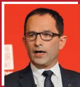
Бенуа Амон Социалистическая партия