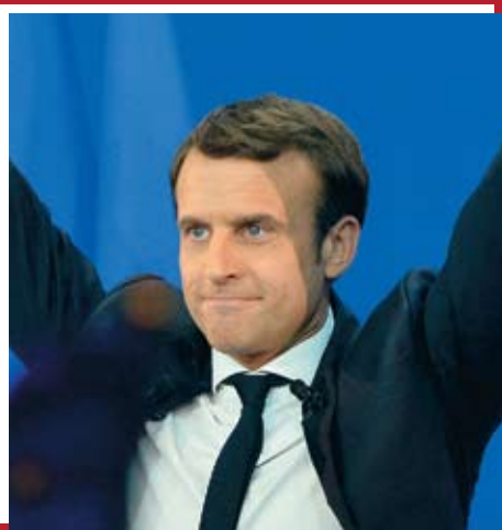
Эммануэль Макрон «Вперед!»