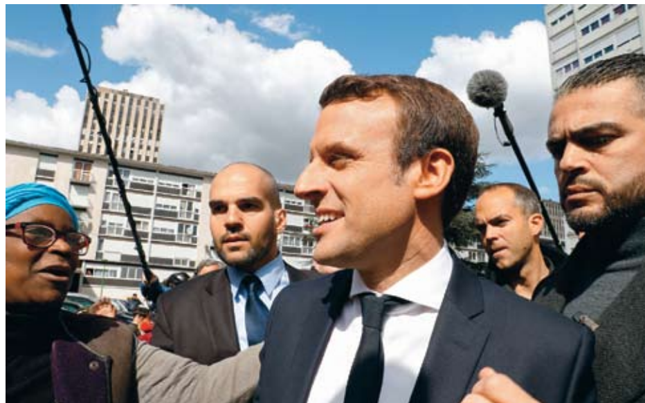
Программа Эммануэля Макрона не содержит даже намека на то, как он намерен преодолеть экономический спад, который Франция переживает последние десять лет

пренебрегало, и жертв «глобализации» глосуют «за».