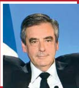
Франсуа Фийон «Республиканцы»