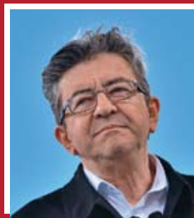
Жан-Люк Меланшон «Непокоренная Франция»