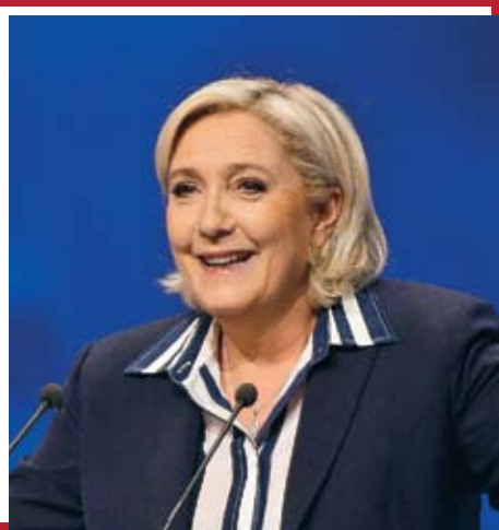
Марин Ле Пен «Национальный фронт»