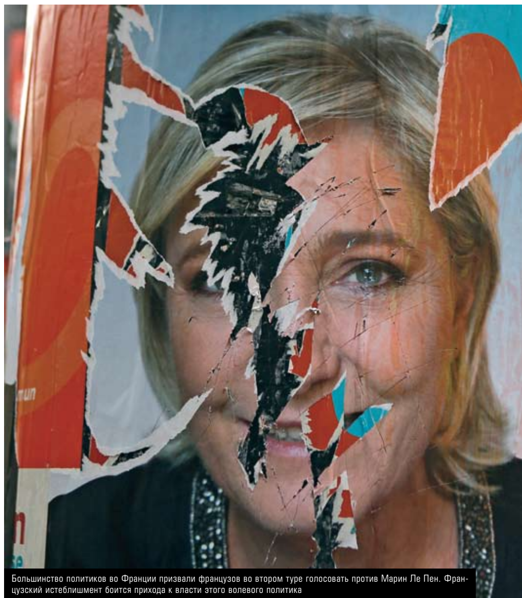
Большинство политиков во Франции призвали французов во втором туре голосовать против Марин Ле Пен. Французский истеблишмент боится прихода к власти этого волевого политика

Кандидатуру Макрона поддержала значительная часть французских СМИ.