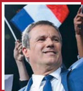
Николя Дюпон-Эньянь «Вставай, Франция!»